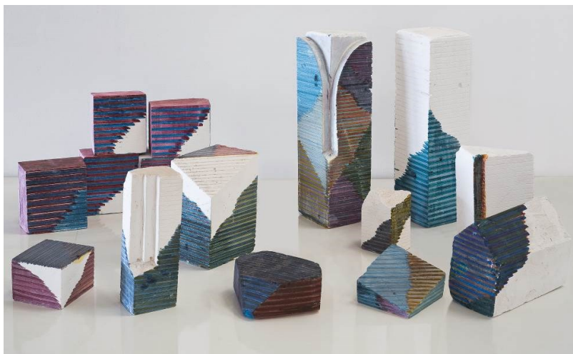
Jean-Michel Meurice, Hommage à Malevitch , 1980 © Jean-Michel Meurice - Adagp, Paris 2017