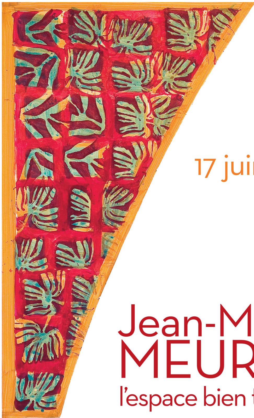
Jean-Michel Meurice, Tagasode 5, dite «la Catalane», 2004 © Jean-Michel Meurice - Adagp, Paris 2017