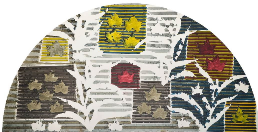
Jean-Michel Meurice, Lipo10 , 1983 © Jean-Michel Meurice - Adagp, Paris 2017

Tout ou partie des œuvres figurant dans ce dossier de presse sont protégées par le droit d'auteur. Les œuvres de l'ADAGP ( www.adagp.fr ) peuvent être publiées aux conditions suivantes :