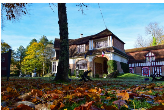
Musée du Touquet-Paris-Plage

Véritable écrin de l'élégance, Le Touquet-Paris-Plage continue à rayonner en attirant toujours aujourd'hui des personnalités de premier ordre.