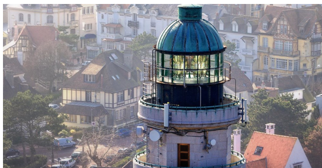
Phare du Touquet-Paris-Plage