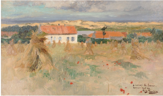
Frits Thaulow, Camiers, maisons au bord de l'étang, 1892 Musée du Touquet-Paris-Plage