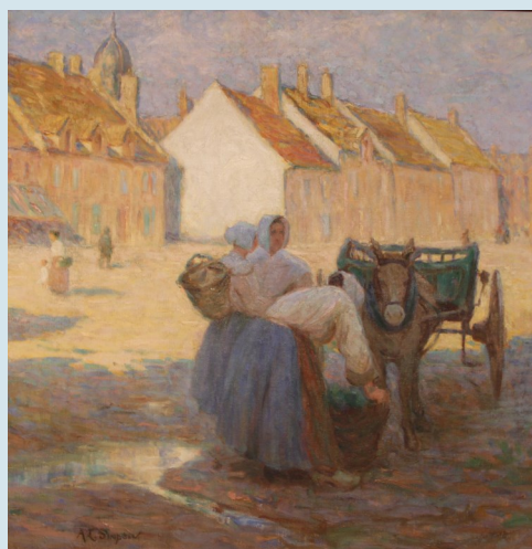
Annie Louise Simpson, La Grand'Place d'Étaples, vers 1905 Musée Quentovic, Étaples

Séduits par le caractère sauvage et la luminosité de la côte, les peintres à la recherche d'authenticité trouvent en bord de mer une animation offrant de multiples sujets de tableaux. Autour des années 1890, l'homme et son cadre de vie semblent l'emporter sur le paysage pur.