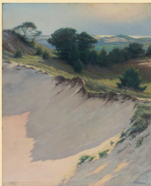
Chester Hayes, Dunes ou Le Croc , 1932, Musée du Touquet-Paris-Plage

L'œuvre Dunes ou Le Croc de Chester Hayes a été restaurée grâce au mécénat de l'association MAC Touquet - Musées Art et Culture Le Touquet-Paris-Plage.