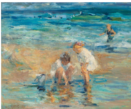
William S. Horton, Enfants sur la plage - Jeux d'eau , vers 1914, collection particulière