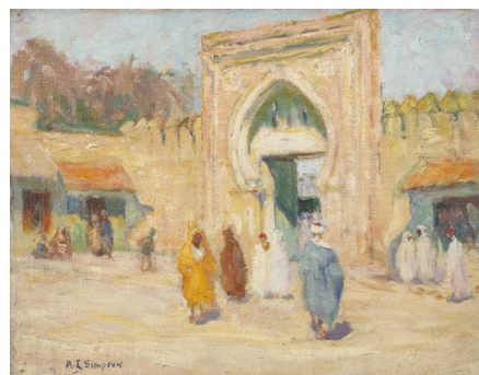
Annie Louise Simpson, Paysage marocain , 1912 Musée du Touquet-Paris-Plage