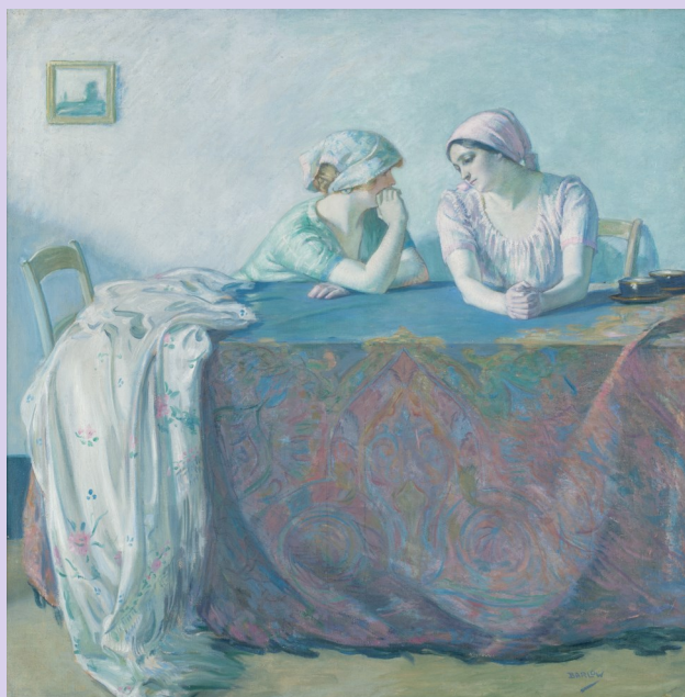
Myron Barlow, Confidences Collection particulière