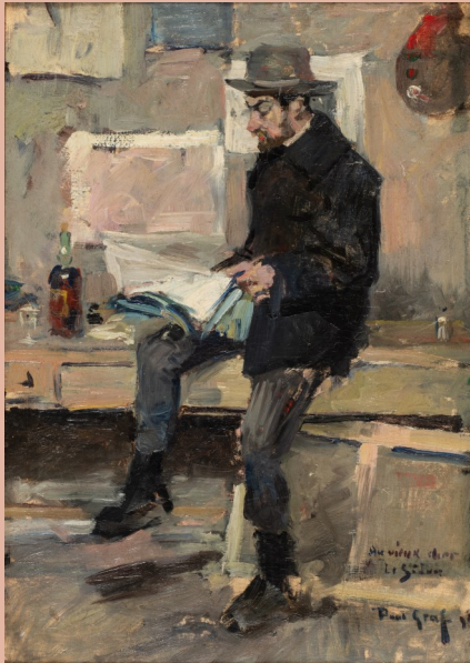
Paul Edmund Graf, Portrait d'Henri Le Sidaner dans son atelier , 1891 Musée du Touquet-Paris-Plage