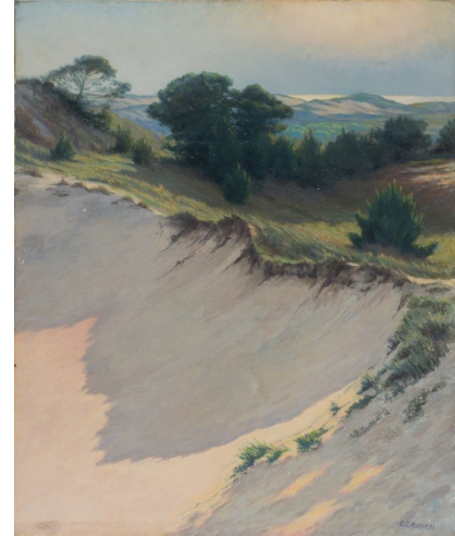
Chester Hayes, Dunes ou Le Croc, 1932, Musée du Touquet-Paris-Plage