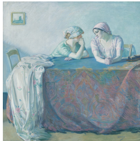
Myron Barlow, Confidences Collection particulière © Xavier Nicostrate