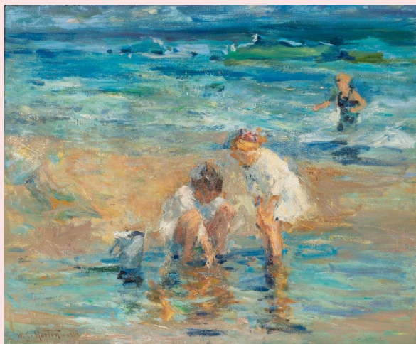
William S. Horton, Enfants sur la plage - Jeux d'eau , vers 1914, collection particulière