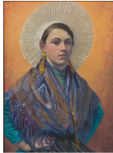
Chester Hayes, Matelote d'Étaples , 1932 Musée du Touquet-Paris-Plage