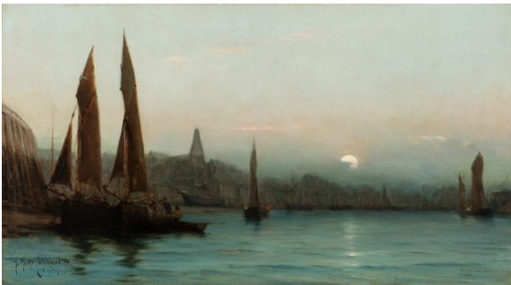
Georges Ricard-Cordingley, Le Port de Boulogne - Clair de lune, 1899 Collection particulière