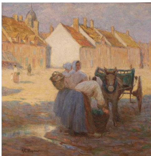
Annie Louise Simpson, La Grand'Place d'Étaples, vers 1905 Musée Quentovic, Étaples