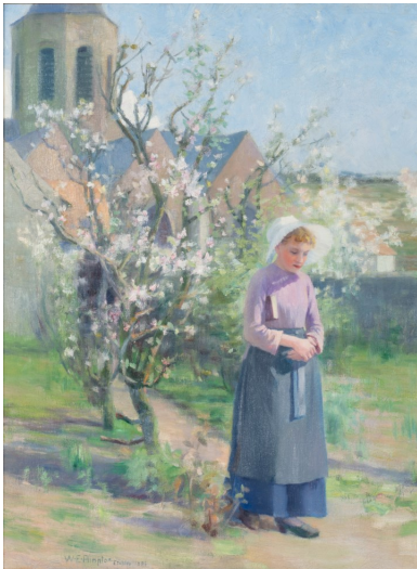
William E. Plimpton, Étaples , 1894, collection particulière