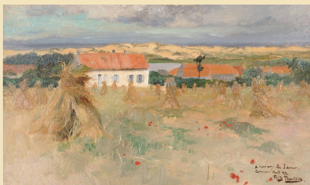
Frits Thaulow, Camiers, maisons au bord de l'étang , 1892 Musée du Touquet-Paris-Plage

À partir des années 1880, les peintres étrangers de la colonie d'Étapes s'exercent en plein air aux côtés d'autres artistes qui les confortent ou permettent leur évolution stylistique. Mais toujours ils oscillent entre ces deux grands courants, entre réalisme austère et variations lumineuses, proposant parfois des synthèses audacieuses.