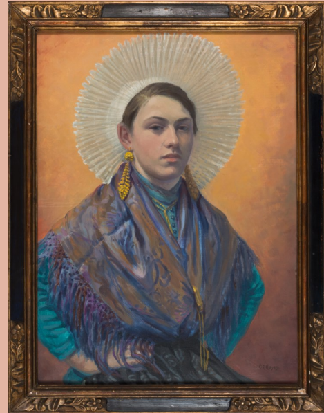
Chester Hayes, Matelote d'Étaples , 1932 Musée du Touquet-Paris-Plage

Historiquement la plupart des portraits sont des commandes, rendant compte de la position sociale du modèle autant que de son apparence. Il est donc requis que le modèle ait les moyens financiers, mais aussi le statut social qui justifie sa représentation.